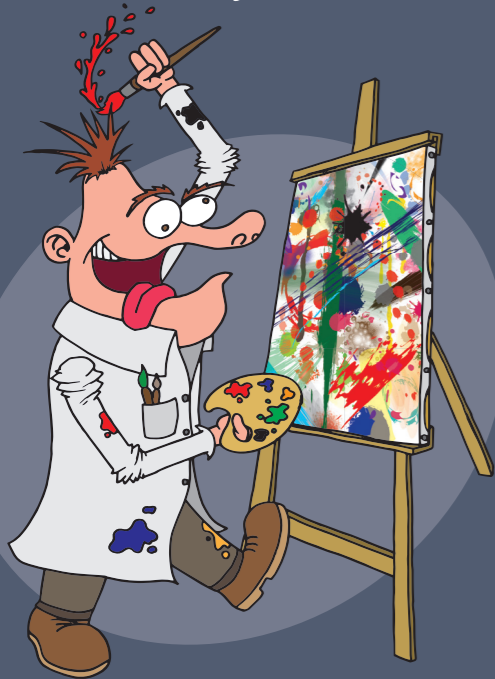
Illustration : Franck Hélias